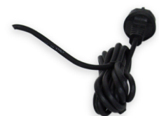
Kabelverlängerung auf 10 Meter 20 230V 35,29 €

Für weitere Informationen schauen Sie bitte im Netz unter www.royal-exclusiv.de . Einfach Artikelnummer oder Name in die Suchmaske eintragen oder email an: info@royal-exclusiv.de .